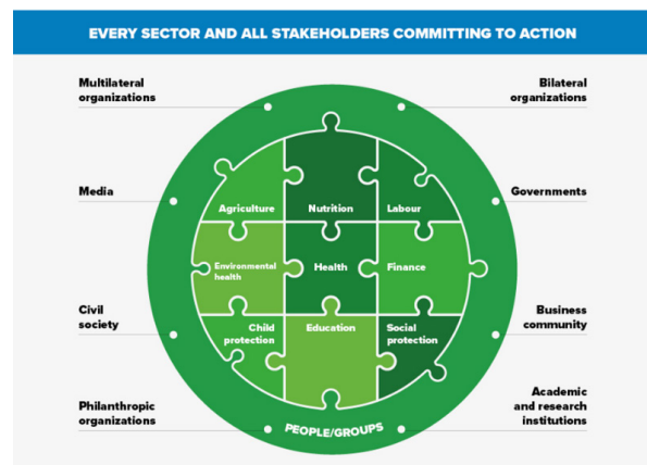
Figure 2: A multi-sectoral approach (NCF, 2018)

Il-Fond Internazzjonali tan-Nazzjonijiet Uniti għat-Tfal (UNICEF) u l-Organizzazzjoni Dinjija tas-Saħħa (WHO) jenfasizzaw li dak li jiġri fl-ewwel snin jaffettwa lit-tfal għall-ħajja kollha tagħhom u għalhekk l-interventi jridu jkunu multisettorjali biex ikunu l-aktar effettivi: