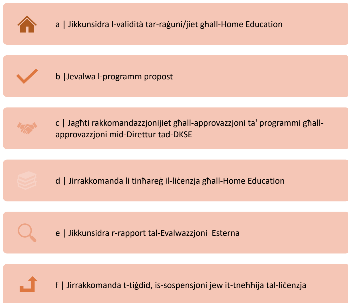
Figura 2. Mandat tal-Bord għall-provediment ta' Home Education.

Il-mandat tal-Bord huwa spjegat f'Figura 2.